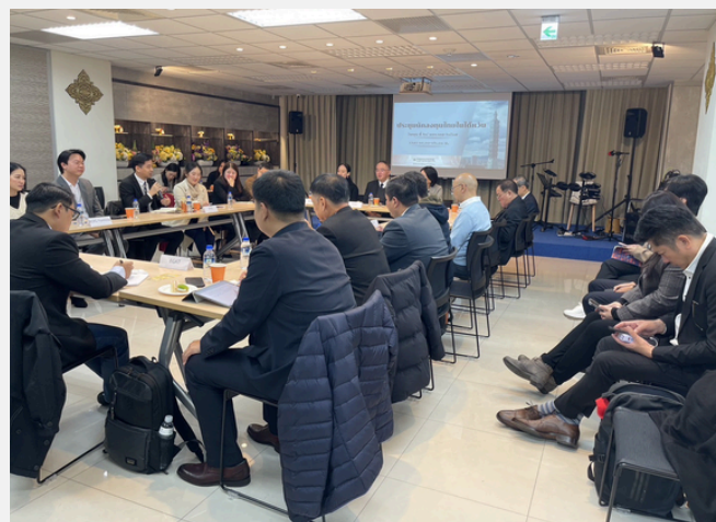
ประชุม “นักลงทุนไทยในไต้หวัน” ที่สำนักงานการค้าและเศรษฐกิจไทย ไทเป

เมื่อวันที่ 24 มกราคม 2567 สำนักงานค้าและเศรษฐกิจไทย ได้จัดการประชุม “นักลงทุนไทยในไต้หวัน” ที่สำนักงานการค้า เพื่อพบปะแลกเปลี่ยนข้อคิดเห็นกับภาคเอกชนไทยในไต้หวัน อย่างรอบด้านเพื่อเสริมความเข้มแข็งของทีมประเทศไทย ผู้แทนภาคเอกชนไทยในไต้หวันที่เข้าร่วมมาจากหลากหลายสาขา อุตสาหกรรม ได้แก่ ผู้แทนจาก CP Group ลงทุนด้านการเกษตร และปศุสัตว์ ผู้แทนจาก SCG International ซึ่งเป็นบริษัทการค้า ระหว่างประเทศ ผู้แทนธนาคารกรุงเทพในสาขาการเงิน รวมทั้ง ผู้แทนนักลงทุนในสาขาพลังงานทดแทน อาทิ บริษัท HOU JU ENERGY TECHNOLOGY CORPORATION บริษัท GPSC บริษัท ECGO บริษัท BPCG Formosa และ EGAT