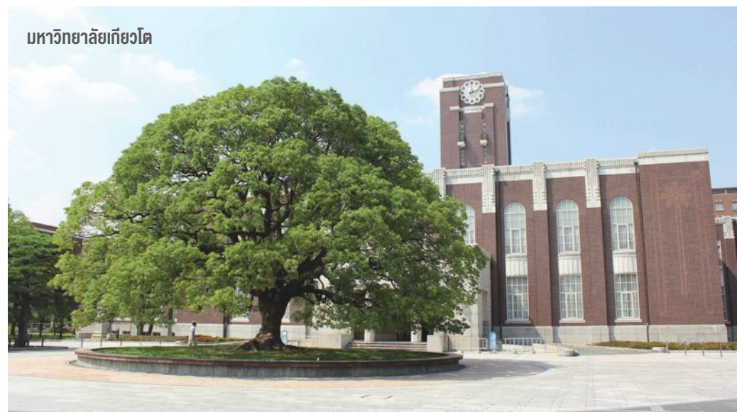
มหาวิทยาลัยเกียวโต