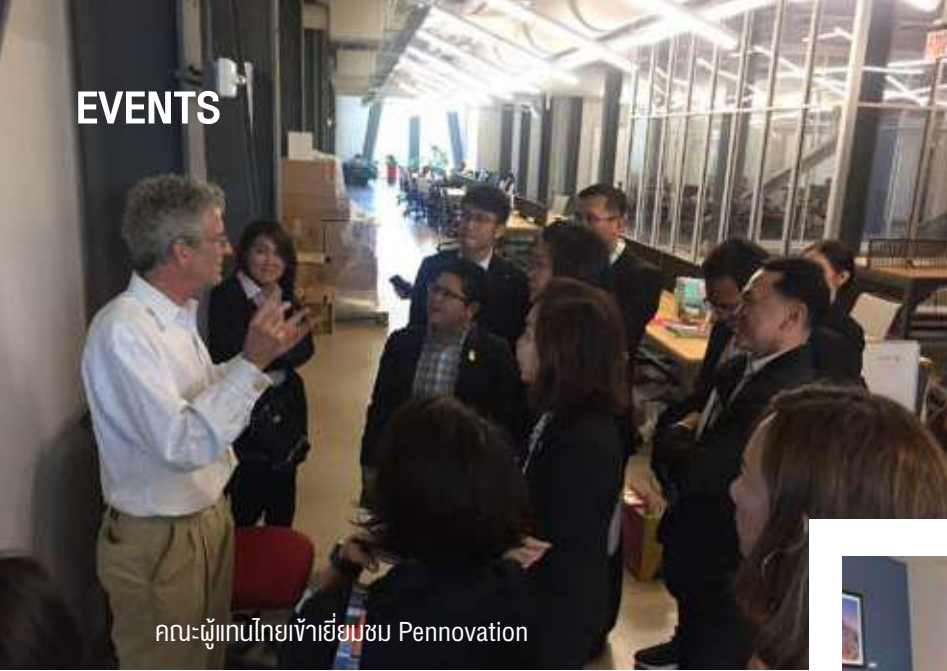
คณะผู้แทนไทยเข้าเยี่ยมชม Pennovation