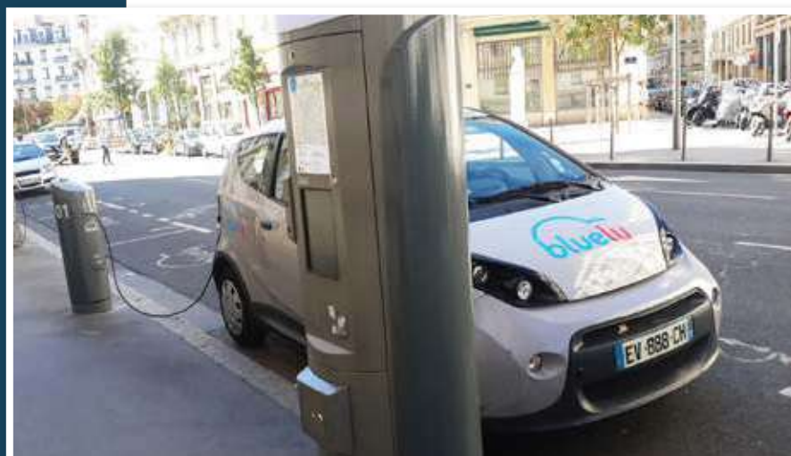
จุดชาร์จไฟฟ้าสำหรับ Bluely รถไฟฟ้าเข้าจับในเมืองลียง

บางประเทศใช้วิธีกำหนดพื้นที่ห้ามรถที่ใช้เครื่องยนต์ดีเซลวิ่งเข้าในพื้นที่ ก็เป็นอีกมาตรการที่เชื่อว่า จะลดการใช้รถยนต์เครื่องยนต์สันดาปภายใน ซึ่งกำลังจะกลายเป็นยานยนต์ของโลกยุคเก่า และเปิดโอกาสให้ยานยนต์สมัยใหม่ที่ไม่ปล่อยไอเสียและเป็นมิตรกับสิ่งแวดล้อมมากกว่าเข้ามาแทนที่หรืออย่างน้อยในช่วงเวลานี้ ก็คือ การหันมาใช้รถสาธารณะหรือระบบการขนส่งแบบ Sharing มากยิ่งขึ้น “ความจริงเป้าหมายของเรา คือ ต้องการให้คนใช้รถน้อยลง ยานยนต์ไฟฟ้าอาจจะเป็นส่วนหนึ่ง แต่ไม่ใช่ทั้งหมด เรามุ่งพัฒนาระบบขนส่งที่ทำให้คนใช้รถส่วนตัวน้อยลง ใช้รถสาธารณะมากขึ้น รวมไปถึงการใช้ระบบแบ่งปันกันใช้ หรือ Sharing Vehicles ให้เข้ามาเป็นส่วนหนึ่งของระบบการขนส่งที่ทันสมัยและยั่งยืน”