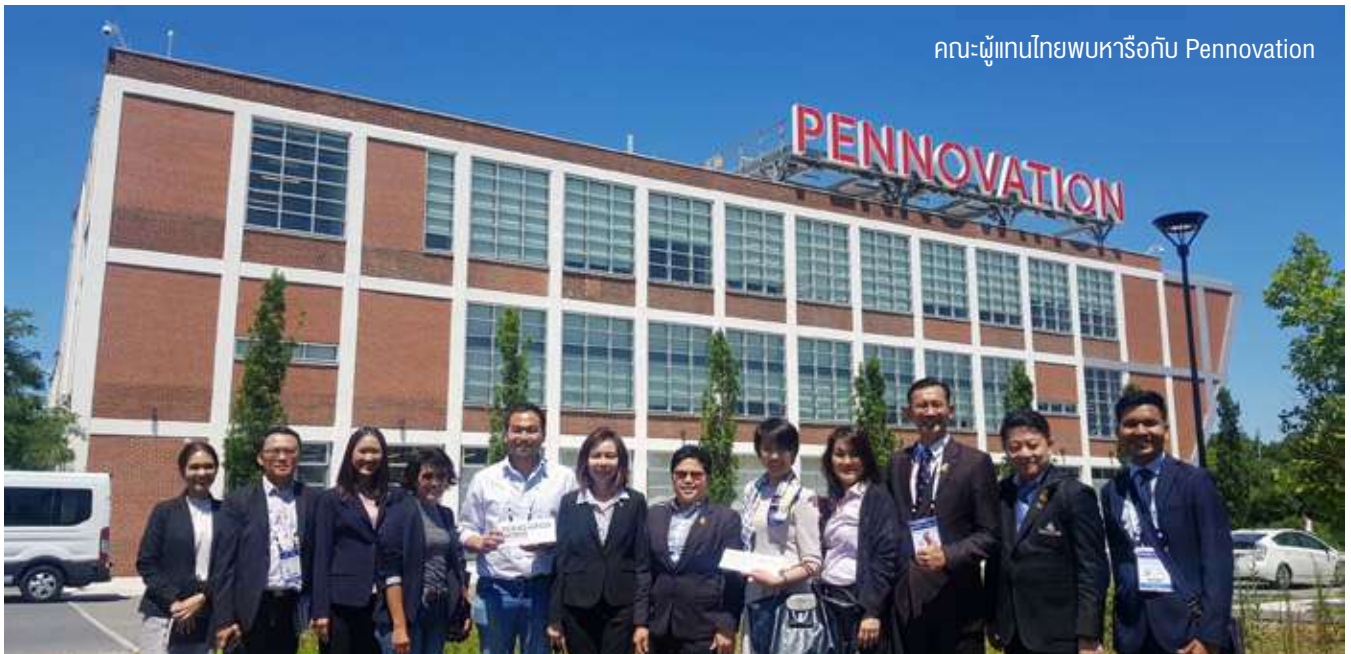
คณะผู้แทนไทยพบหารือกับ Pennovation

กรมเศรษฐกิจระหว่างประเทศ | GLOBTHAILAND.COM