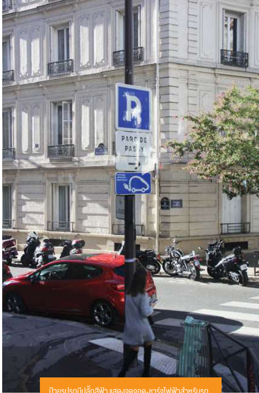
ป้ายรูปรถบีโปลัสไฟฟ้า แสดงจุดจอด-ชาร์จไฟฟ้าสำหรับรถอีวี มีให้เห็นทั่วไปในย่านใจกลางกรุงปารีส

สหภาพยุโรป หรือ อียู เป็นกลุ่มประเทศที่มีบทบาทนำในการส่งเสริมอุตสาหกรรมยานยนต์สมัยใหม่ นอกจากนี้จะเป็นฐานการผลิตของบริษัทยานยนต์ระดับโลกแล้วยังเป็นแหล่งบ่มเพาะบริษัทผู้เชี่ยวชาญในนวัตกรรมที่เกี่ยวข้องกับอุตสาหกรรมยานยนต์และการขนส่งที่ทันสมัยครอบคลุมไปจนถึงซอฟต์แวร์ที่เกี่ยวข้องกับการบริหารจัดการระบบขนส่ง อียูยังเป็นตลาดที่มีการใช้ยานยนต์ไฟฟ้าที่ได้ชื่อว่าเป็น “ยานยนต์แห่งอนาคต” อย่างแพร่หลาย มีการกำหนดนโยบายของภาครัฐที่ช่วยเกื้อหนุนการพัฒนาอุตสาหกรรมยานยนต์และระบบขนส่งสมัยใหม่อย่างชัดเจน เช่น การกำหนดกรอบดำเนินการเพื่อลดปริมาณการปล่อยก๊าซเรือนกระจก ภายในปี 2030 (พ.ศ. 2573) โดยประเทศสมาชิกจะต้องลดปริมาณการปล่อยก๊าซเรือนกระจกลง 40% (เมื่อเทียบกับระดับของปี 2533) ภายในกรอบเวลาดังกล่าว ทำให้กลุ่มอุตสาหกรรมที่อยู่ภายใต้การควบคุม ซึ่งรวมถึงอุตสาหกรรมยานยนต์และชิ้นส่วน และการคมนาคมขนส่ง ต้องเข้ามามีส่วนร่วมลดปริมาณการปล่อยก๊าซเรือนกระจกเช่นกัน นำไปสู่การคิดค้น วิจัย และพัฒนายานยนต์ที่ใช้พลังงานทางเลือกและปล่อยไอเสียต่ำ หรือ ไม่มีการปล่อยไอเสียเลย เช่น ยานยนต์ไฟฟ้ารูปแบบต่าง ๆ