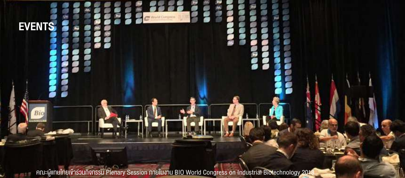
คณะผู้แทนไทยเข้าร่วมกิจกรรม Plenary Session ภายในงาน BIO World Congress on Industrial Biotechnology 2018

สำหรับผู้ประกอบการที่ต้องการส่งออกสินค้าเทคโนโลยีชีวภาพไปสหรัฐอเมริกา ควรศึกษาแนวโน้มและความต้องการของตลาดสหรัฐอเมริกาควบคู่กับการสร้างมาตรฐานให้กับสินค้าตลอดห่วงโซ่การผลิต โดยสหรัฐอเมริกาให้ความสำคัญต่อประเด็นความปลอดภัย และสินค้าต้องผ่านการรับรองมาตรฐานภายใน คือ ตราสัญลักษณ์ USDA ออกโดยกระทรวงเกษตรของสหรัฐอเมริกา เพื่อเป็นการยืนยันว่าสินค้านี้มีกระบวนการผลิตที่ได้มาตรฐานและเป็นสินค้าที่ผลิตจากทรัพยากรชีวภาพอย่างแท้จริง